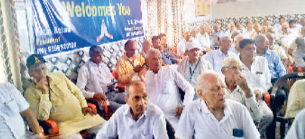
हरिभूमि न्यूज़ ▶▶ सोनीपत