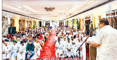
सोनीपत। कार्यकर्ताओं की बैठक को संबोधित करते हुए अजय सिंह चौटाला।

जननायक जनता पार्टी के राष्ट्रीय अध्यक्ष डॉ अजय सिंह चौटाला ने कहा है कि आज देश की जनता भाजपा से दुखी होकर बीजेपी को पूरी तरह से नकार रही है और यह बाद देश में हुए उपचुनावों के परिणाम से साबित होती है। उन्होंने कहा कि कभी 75 पर, तो कभी 400 पर का नारा देने वाली भाजपा को जनता अविना दिखा चुकी है। अजय चौटाला रविवार को सोनीपत में