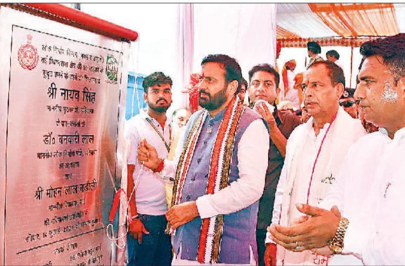
सोनीपत। विकास कार्यों का शिलान्यास करते मुख्यमंत्री नायब सिंह सैनी।

मुख्यमंत्री ने कहा कि आज वीर शिरोमणि महाराणा प्रताप की प्रतिमा का अनावरण करना मेरे लिए सौभाग्य की बात है। यह प्रतिमा नई पीढ़ियों को महाराणा प्रताप जैसी वीरता, देशभक्ति और साहस की हमेशा प्रेरणा देती रहेगी। उन्होंने कहा कि प्रदेश के 509 स्कूलों के नाम आज शहीदों के नाम पर रखे गए हैं। इसी तरह से करनाल के अंजनस्थली में महाराणा प्रताप बागवानी विश्वविद्यालय स्थापित किया गया है।