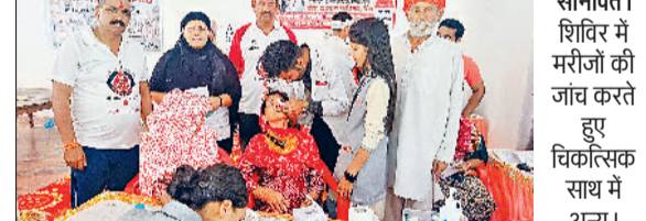
सोनीपत। शिविर में मरीजों की जांच करते हुए चिकित्सक साथ में अन्य।