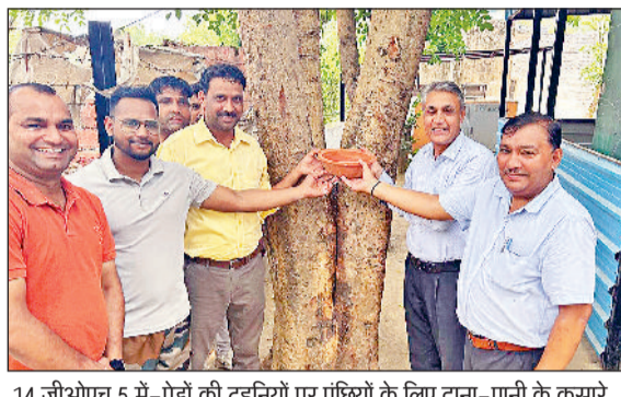
14 जीओएच 5 में-पेड़ों की टहनियों पर पछियों के लिए दाना-पानी के कसारे बांधते हुए अतिथि व संगठन सदस्य।