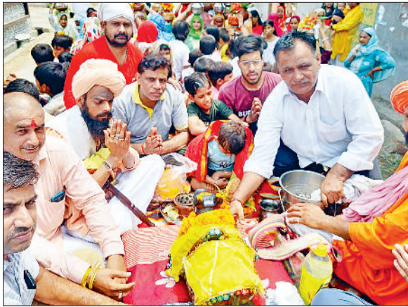
गन्नाैर। मन्दिर में नंदी की मूर्ति स्थापना से पूर्व कलश यात्रा निकालती महिलाएं एवं मन्दिर के बाबा ।

हरियाणा मांगें हिसाब अभियान की शुरुआत की सांसद दीपेंद्र सिंह हुड्डा ने बताया कि अखिल भारतीय कांग्रेस कमेटी के सुझाव पर हरियाणा प्रदेश कांग्रेस ने हरियाणा मांगें हिसाब अभियान की शुरुआत की है। उन्होंने प्रस्ताव रखा कि हरियाणा मांगें हिसाब और कांग्रेस से ही है आस जिसे सभी ने हाथ उठाकर ध्वनिमत से पारित किया। इसके तीन पहलू बताते हुए सांसद दीपेंद्र हुड्डा ने कहा कि भाजपा सरकार के खिलाफ 15 सालों को हर घर तक लेकर जायेंगे। कांग्रेस पार्टी के संकल्पों को घर-घर तक पहुंचाकर लोगों को अवगत करायेंगे। कांग्रेस पार्टी द्वारा तैयार किये जा रहे जनता के घोषणा पत्र के लिये लोगों से प्राप्त सुझावों को सुझाव पेटि में एकत्रित करेंगे। तहत सभी नेता व कार्यकर्ता बीजेपी की करगुजारियां जनता के समक्ष उजागर करेंगे। साथ ही कांग्रेस की घोषणाओं के बारे में लोगों को बताएंगे और पार्टी के मैनिफेस्टो को लेकर जनता से सुझाव मांगेंगे। कांग्रेसजन जनता के बीच जाकर बताएंगे कि 2014 तक जो हरियाणा प्रति व्यक्ति आय, प्रति व्यक्ति निवेश, रोजगार देने, खेल-